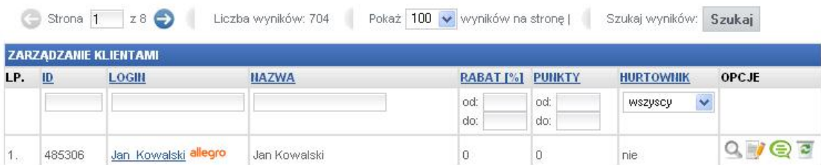
Zarządzanie Klientami sklepu