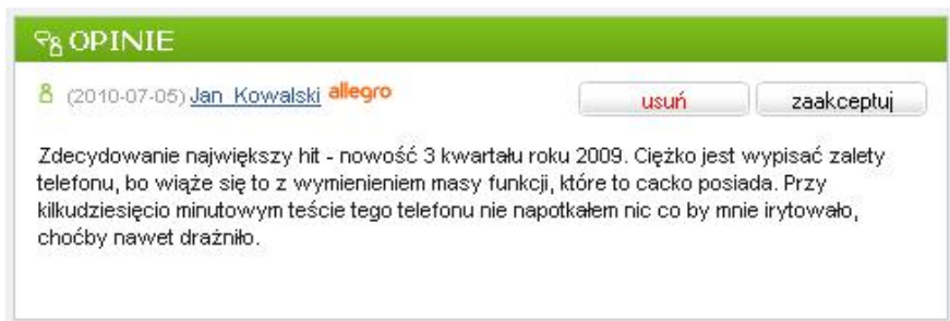
Opinie do zaakceptowania w panelu administracyjnym sklepu

Na stronie głównej panelu administracyjnego w boksie „Opinie”, masz dostęp do wszystkich opinii, które oczekują na Twoją akceptację do wyświetlenia w sklepie. Po kliknięciu przycisku: „Zaakceptuj”, opinia wyświetli się na karcie produktu w sklepie. Kiedy klikniesz przycisk „usuń”, opinia zostanie trwale usunięta.